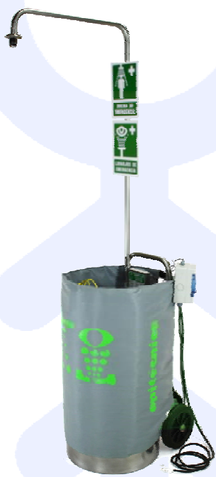
Ducha con Lavaojos Portátil con manta térmica Recomendado hasta -20°C