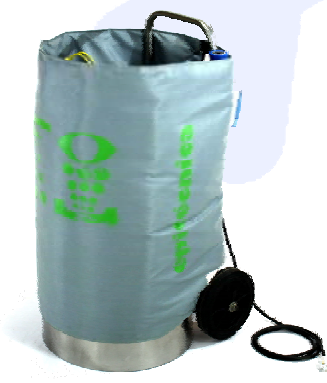
Lavaojos Portátil con manta térmica Recomendado hasta -20°C