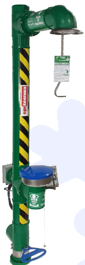
Ducha con Lavaojos Anticongelante con HEAT TRACING Recomendado hasta -20°C

Además tenemos un sistema automático que evita el sobrecalentamiento del agua de la tubería por efectos del sol, impidiendo que al accionar la Ducha o el Lavaojos salga agua muy caliente.