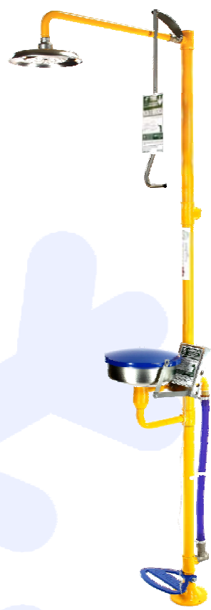
Ducha con Lavaojos Anticongelante Recomendado hasta -10°C