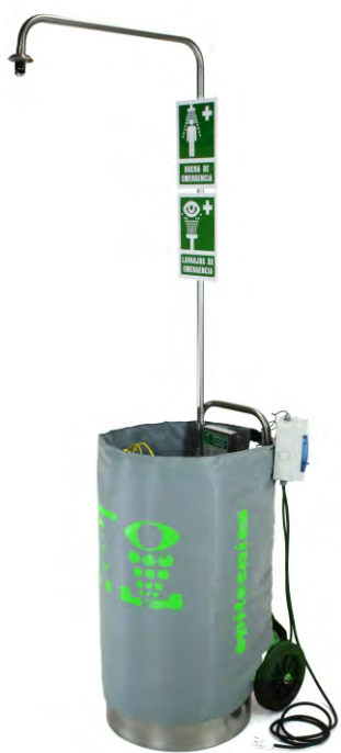
Ducha con Lavaojos Portátil con manta térmica Recomendado hasta -20°C