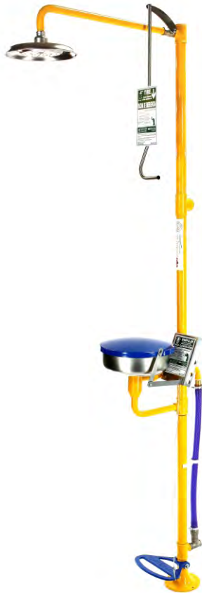
Ducha con Lavaojos Anticongelante Recomendado hasta -10°C

Además tenemos un sistema automático que evita el sobrecalentamiento del agua de la tubería por efectos del sol, impidiendo que al accionar la Ducha o el Lavaojos salga agua muy caliente.