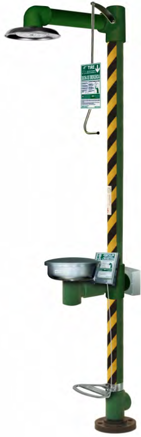
Ducha con Lavaojos Anticongelante con HEAT TRACING Recomendado hasta -20°C