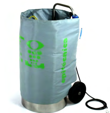
Lavaojos Portátil con manta térmica Recomendado hasta -20°C