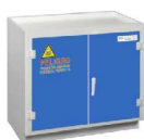
OPCIONAL CON PUERTAS AZULES