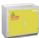
OPCIONAL CON PUERTAS AMARILLAS