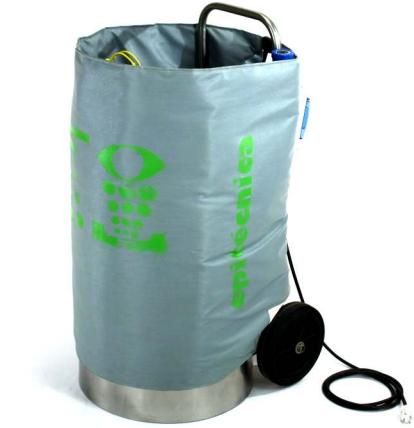
Lavaojos Portátil con manta térmica Recomendado hasta -20°C

Los lavaojos anticongelantes de Epitecnica eliminan automáticamente toda el agua residual del lavaojos, evitando que ésta se congele y dañe la válvula y el lavaojos.